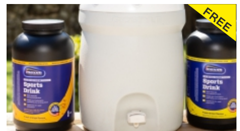
Iso-Drink | zum Abfüllen