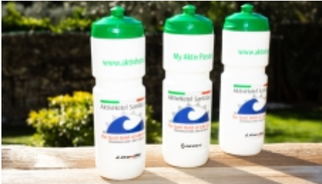
AktivHotel Trinkflasche | € 5,00 p.St.