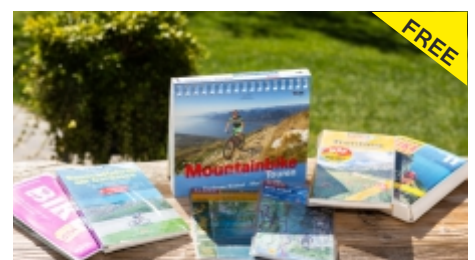
Fachbücher & Karten zur Ansicht (oder zu Verkaufen)