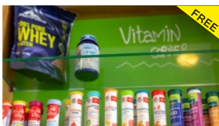
Vitamin und Protein-Ecke mit Nahrungsergänzung