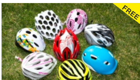
Fahrrad-Helme zum Ausleihen