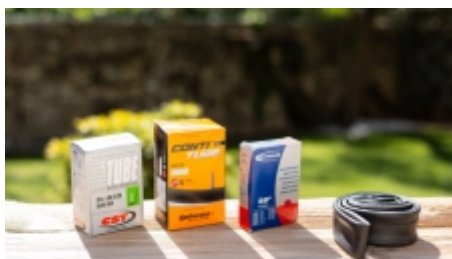
Bike-Schlauch 26/27.5/29" u. RoadB. | € 5,00 p.St.