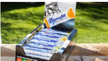
Energieriegel | € 1,50 p.St.