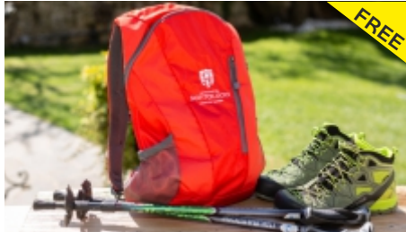
Leih-Rucksäcke & Nordic-Walking Stöcke