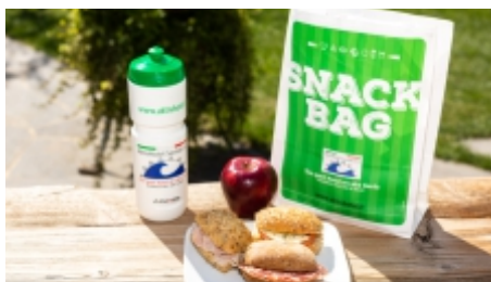
Lunch Box zum Mitnehmen | € 4,00 p.St.