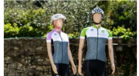
Bike-Trikots | € 89,00 p.St.