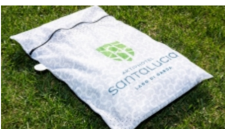
Wäschesack für Wäscheservice | € 5,00 einmalig