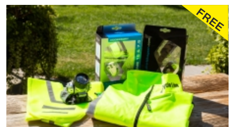
Sicherheitsausrüstung um Ausleihen