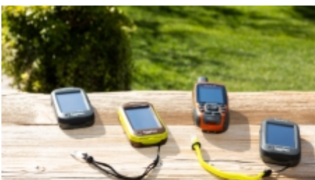
GPS-Verleih mit Routen | € 10 p.Tag